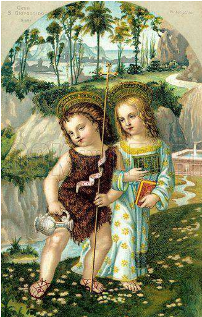
Jesus en Johannes de Doper als kinderen Postkaart begin 20ste eeuw. naar een schilderij van Pintoricchio, circa 1454, Italiaanse kunstschilder. (Siena)

Toen zijn leerlingen ervan gehoord hadden, kwamen ze zijn lijk halen en legden het in een graf.