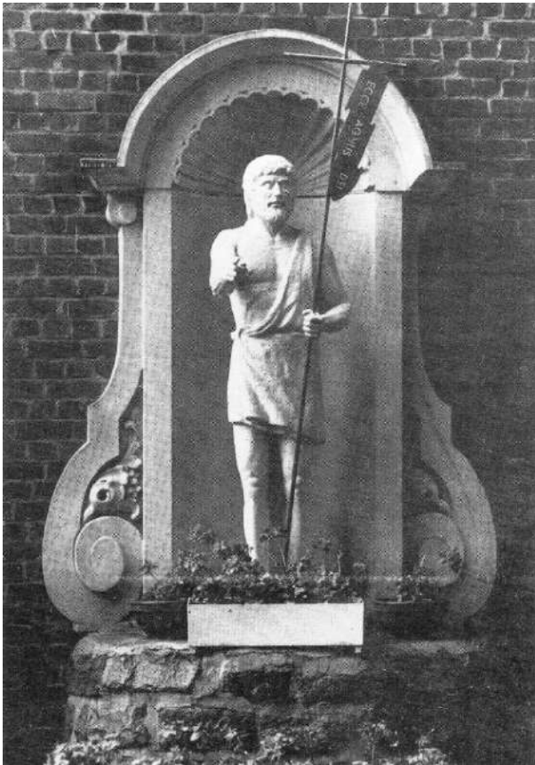
Het oude Sint-Jansbeeld, gemaakt door Rudi Windels, anno 1978 ongeveer op de plaats van het huidige Sint-Jansbeeld.